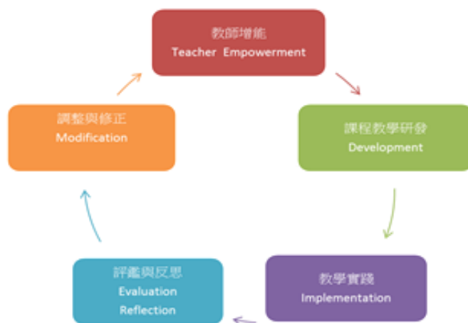
英語情境中心課程設計與發展的實施歷程圖

本社群在英語情境中心課程設計與發展的實施歷程如下圖。以下分為課程教學研發、教學實踐、評鑑與反思、調整與修正及教師增能詳加說明。